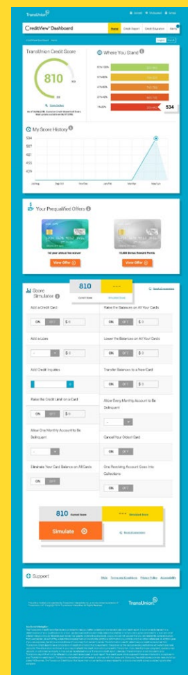
TABLEAU DE BORD CREDITVIEW